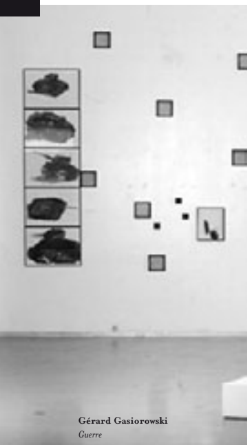
Gérard Gasiorowski Guerre

Malgré la scène mais grâce à la scène, l'improvisation aide d'abord à comprendre cette nécessité-là, mais plus avant, elle pourrait aussi amener l'ensemble de la musique à s'y confronter.